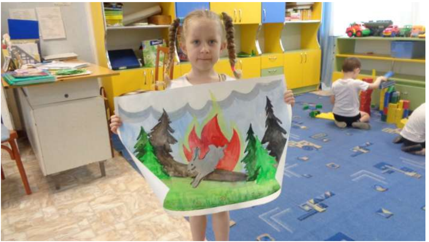
Дети вместе с педагогами разместили плакаты в коридорах детского сада.