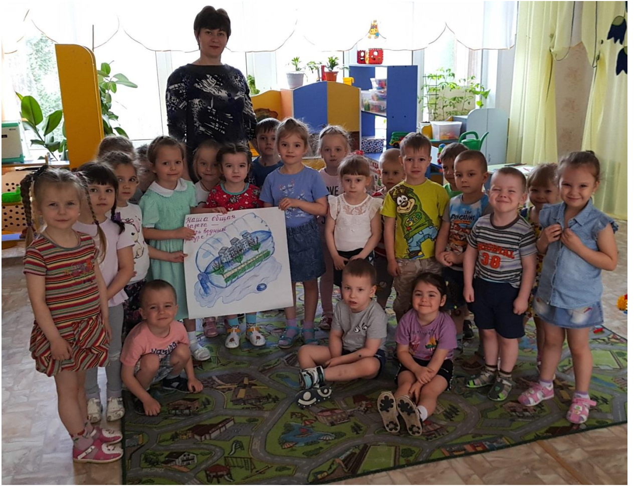
«Наша общая задача – беречь водные ресурсы», вторая младшая группа № 14 «Колокольчики».