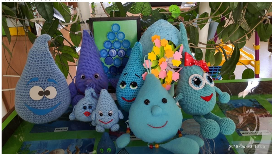
Необычные и симпатичные символы природоохранной акции «Капелька»

Отрывок из письма потомкам: «Просим вас о разумном использовании водных ресурсов, о восстановлении очистительных сооружений и создание новых. Не один из живых организмов нашей планеты не может существовать без воды».