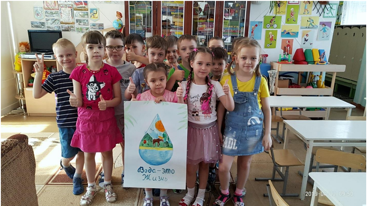
Дети подготовительной к школе группа № 1 «Рябинки» с плакатом «За сохранения воды».