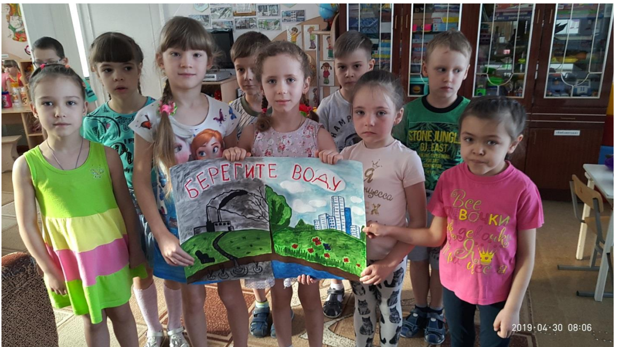
«Берегите воду!», подготовительная к школе группа № 1 «Рябинки».