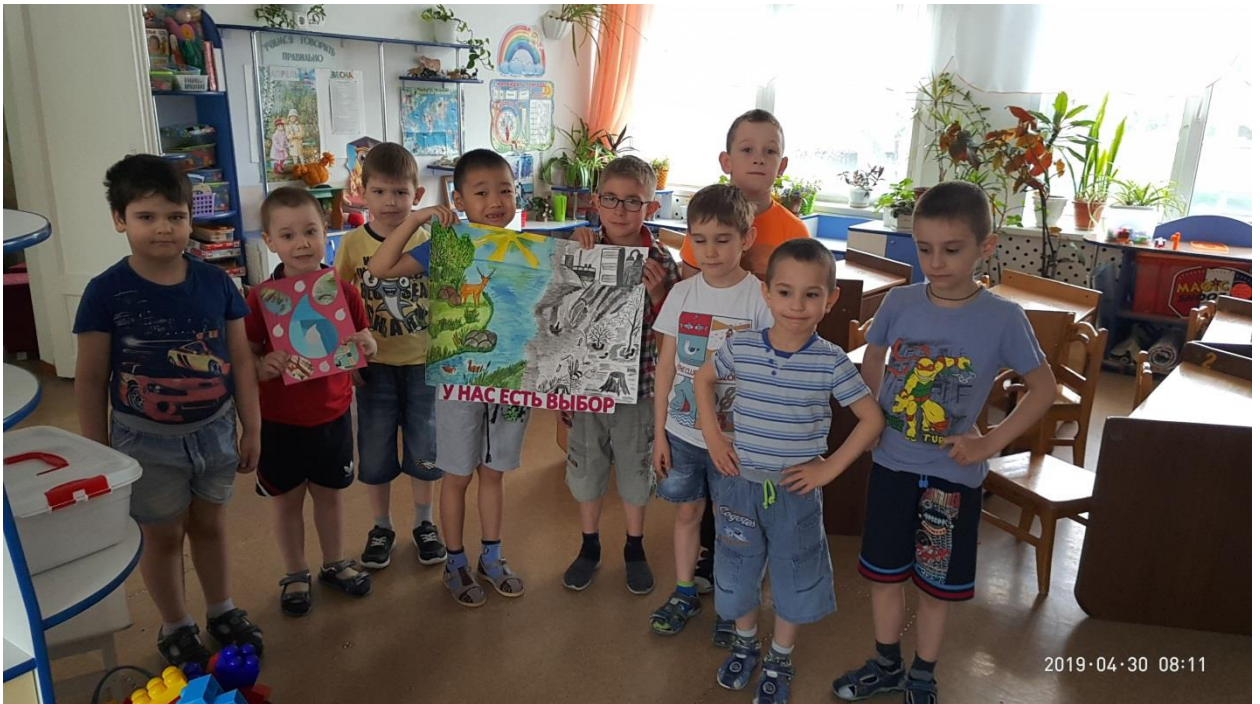
«У нас есть выбор...» - с этим согласны дети старшей группы № 9 «Ромашки».