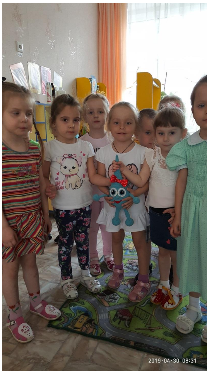
Оригинальная капелька во второй младшей группе № 14 «Колокольчики».