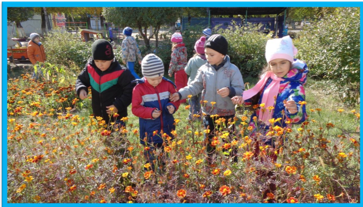
Сбор семян бархатцев

Малые детки сидят на ветке, как подрастут – на землю упадут. (Семена)