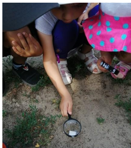
Любимое занятие, наблюдение за муравьями