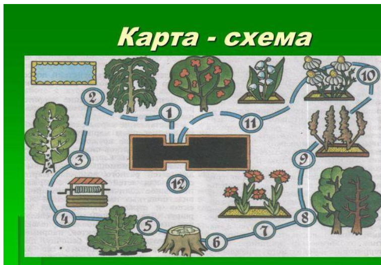
Экологическая тропинка: 1 - рябина, 2 - ива, 3 — береза, 4 - колодец, 5 — кустарник, 6 — лень, 7 - цветник, 8 - липы, 9 — степные растения, 10 — лекарственные растения, 11 - лесные растения, 12 —