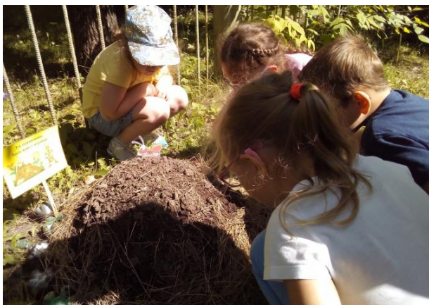
Новый объект экологической тропинки